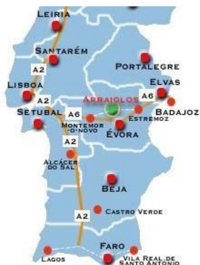
Fig. 1: Localização de Arraiolos no território nacional.

Arraiolos é uma vila alentejana situada no distrito de Évora e cobre uma área territorial de 684,08Km 2 . Tem uma população de 7.363 habitantes (Censos 2011), é sede de Concelho e agrega cinco freguesias: Arraiolos, Igrejinha, Vimieiro, União das Freguesias de S. Gregório e Santa Justa e União das Freguesias da Gafanhoeira (São Pedro) e Sabugueiro. Dista 136 km de Lisboa, 95 km de Espanha e 22 km de Évora.