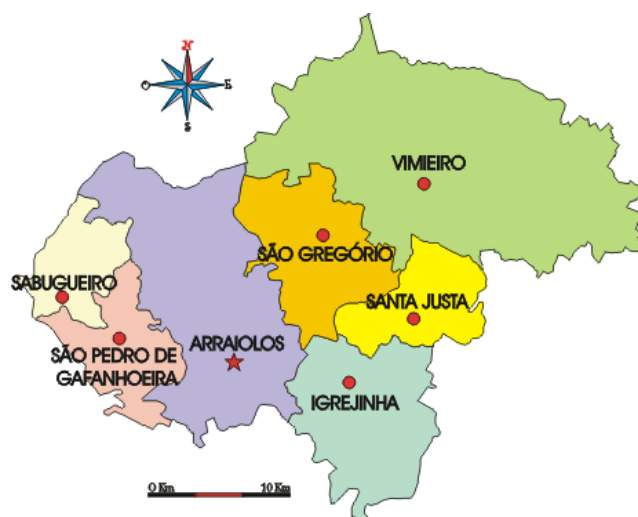
Fig. 2: Mapa do Concelho com Freguesias.