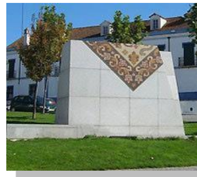
Fig. 4: Monumento à tapeteira