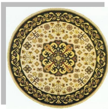
Fig. 3: Tapete de Arraiolos

A vila de Arraiolos é conhecida pela confeção de tapetes, segundo uma técnica de bordado e design que remonta ao séc. XVII., e pela sua comercialização. Existe na localidade um Centro Interpretativo do Tapete, sendo resultado de uma reflexão em que se pretendeu associar a história, origens e influências do Tapete de Arraiolos, ao seu processo artesanal de produção, às suas técnicas e materiais, bem como apresentar a sua evolução artística, material e técnica. Neste momento o processo de confeção do tapete de Arraiolos encontra-se na fase de consulta pública para efeitos de inscrição no inventário nacional do património cultural imaterial, até outubro de 2021.