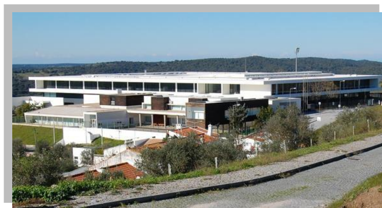
Fig.6: Escola Sede