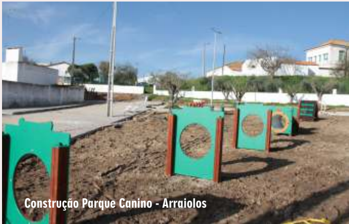
Construção Parque Canino - Arraiolos