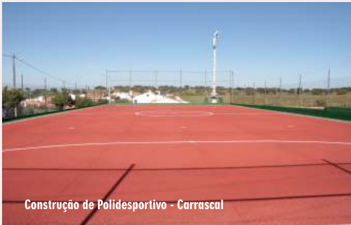
Construção de Polidesportivo - Carrascal