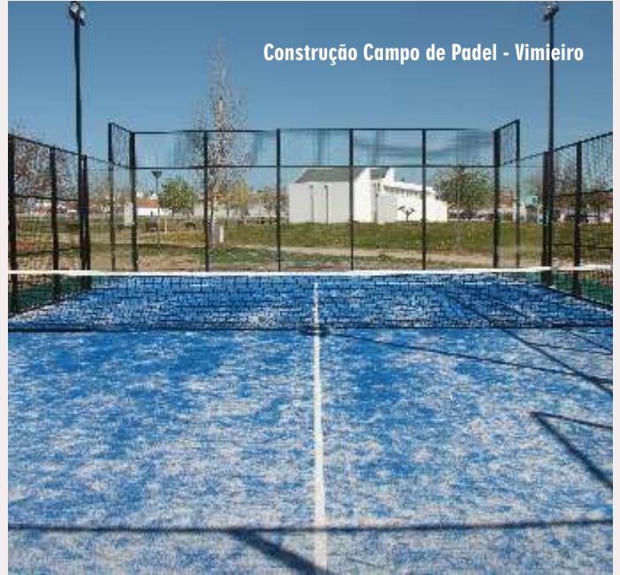
Construção Campo de Padel - Vimieiro