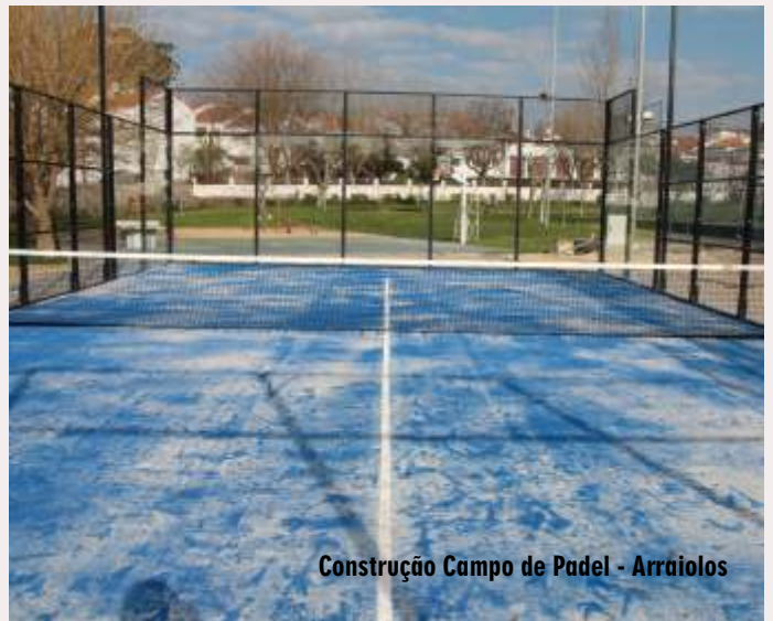
Construção Campo de Padel - Arraiolos