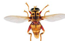
Moscas das flores, Milesia crabroniformis