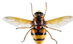
Moscas das flores, Volucella zonaria