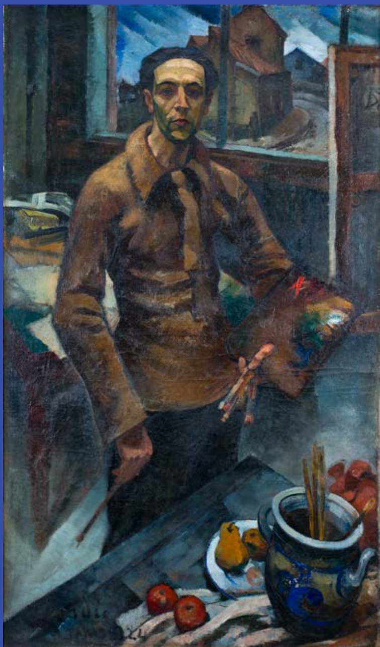
Grande auto-retrato da natureza morta , 1924 Óleo sobre tela, 149 x 90 cm Coleção particular